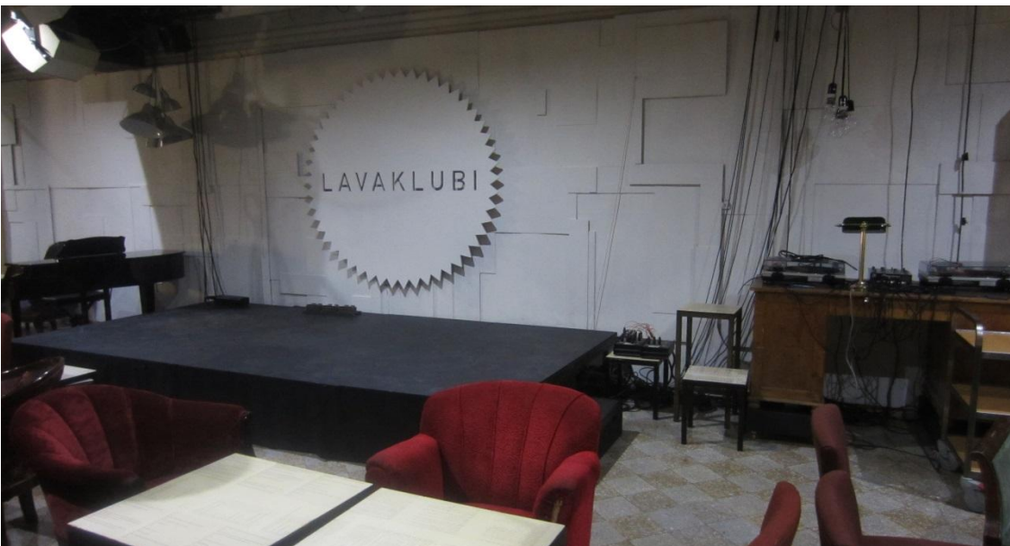
KANSALLISTEATTERI TOIMITTAÄ ESIIINTYJIIEN KÄYTTÖÖN