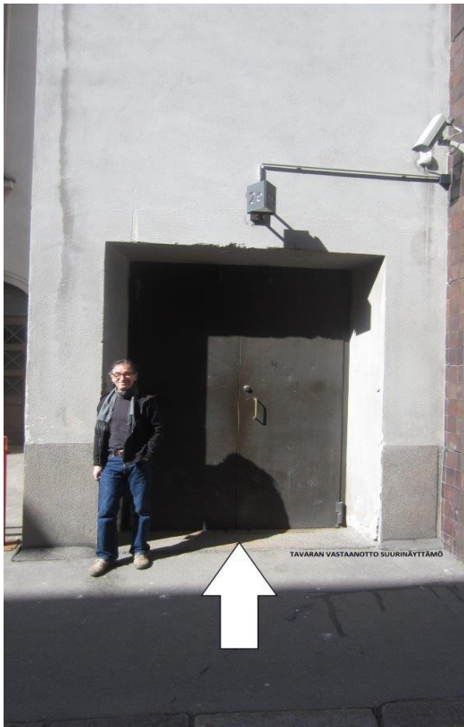
TAVARA SISÄÄN SUURINÄYTTÄMÖ